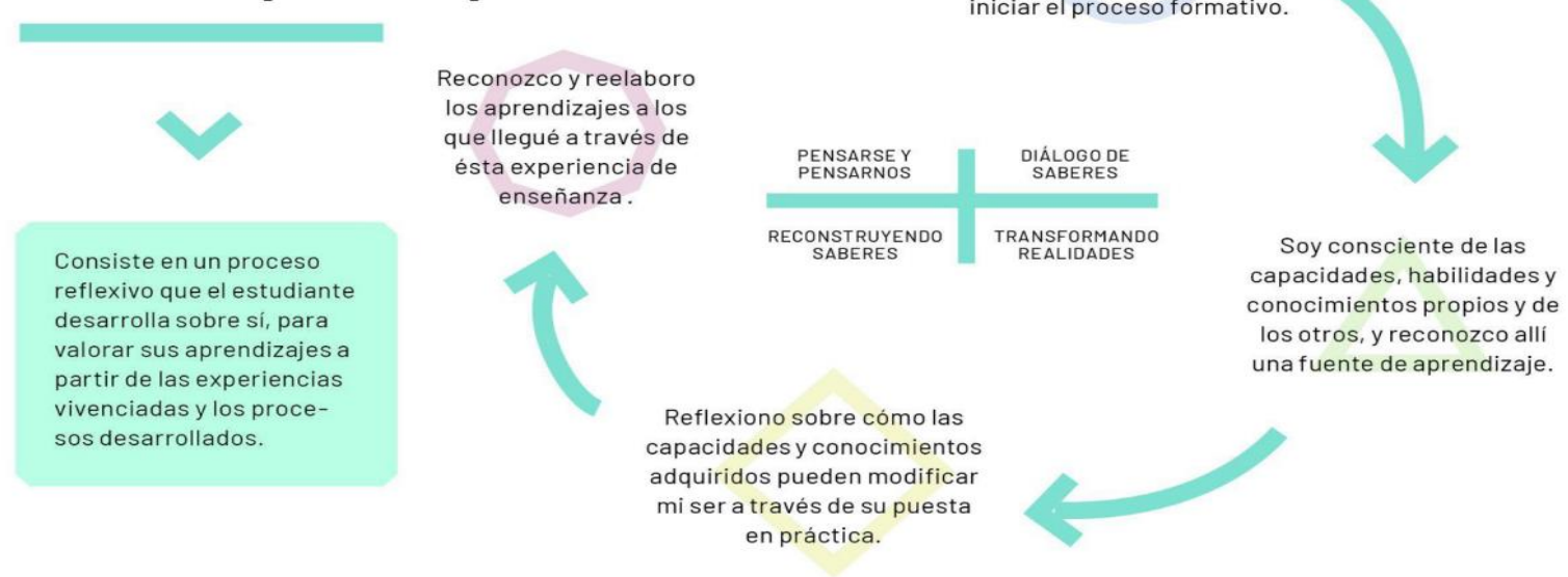
Gráfico 14. Propuesta de evaluación desde el modelo Reflexión-Acción-Participativa [RAP]

La evaluación está sujeta al criterio personalizado: reconoce la importancia del diálogo entre estudiante y docente; permite la comprensión de las circunstancias particulares, inquietudes, preferencias o dificultades de ambas partes y exige del profesor conocimientos interdisciplinarios y flexibilidad de acción.