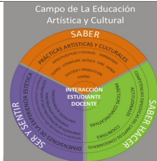
Saberes propios del campo de las artes.

Es de resaltar que la propuesta del plan de área tiene correspondencia con lo planteado en un inicio en el documento No 16 Orientaciones para la Educación Artística (Ministerio de Educación Nacional, 2010) y ahora en las Orientaciones curriculares para la educación artística y cultural en educación básica y media (Ministerio de Educación, 2022), los cuales sostienen que los procesos de formación artística tanto en la primera infancia, como en la básica primaria y secundaria, deben atender a la necesidad de la educación por las artes, marcando una notable diferencia en relación a la educación para el arte.