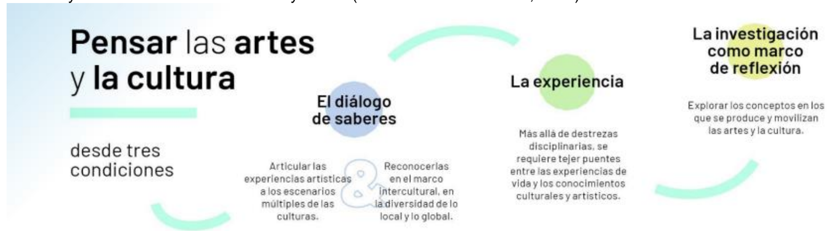
Imagen: Relación entre artes, cultura y competencias.

Si fusionamos todo lo anterior entendemos la enseñanza de las artes desde tres miradas que deben cohabitar y posibilitar la manifestación y expresión artística en todo su furor, es así como arte, cultura y competencias se desarrollan en el aula escolar y logran trascender los territorios. (Orientaciones curriculares para la educación artística y cultural en educación básica y media (Ministerio de Educación, 2022))