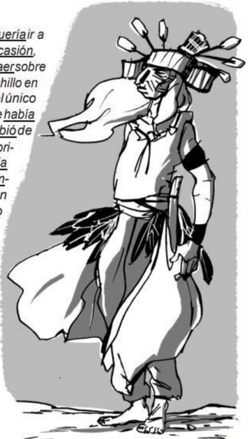
Jordi SIERRA I FABRA