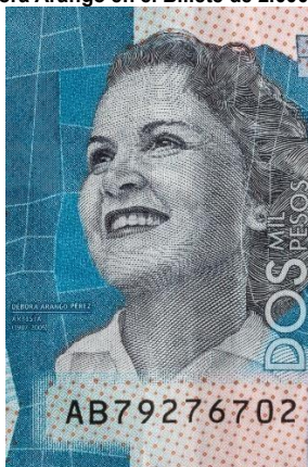
Devora Arango en el Billete de 2.000