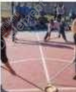
Deportes alternativos, una... mendocino.com