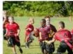
La llegada de los deportes alternativos... sucia.es