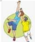
Deportes y juegos altern... abc.com.py