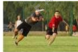
Deporte Alternativo - Ecuifed ecured.cu