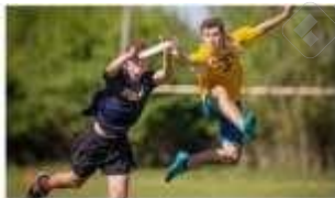
Qué son los deportes alternativos? alorredigital.com

Los Deportes Alternativos son actividades que podemos utilizar como un medio para alcanzar un correcto desarrollo motor, a través de la adquisición y perfeccionamiento de destrezas y habilidades instrumentales dentro de un contexto significativo de comportamiento humano.