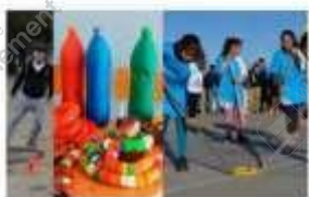
Deportes alternativos para pasar la esarentena laesalud.com